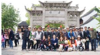
2013 年 4 月组织公司未婚青年赴鲁镇开展联谊活动