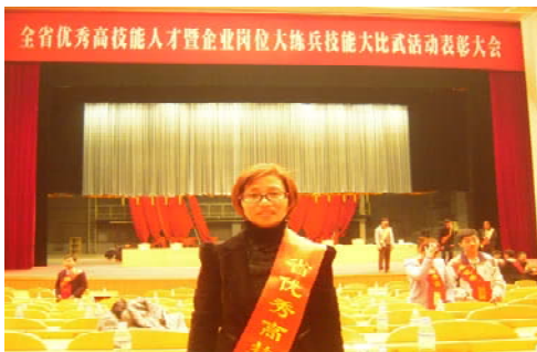
品管部员工获浙江省化学检验工竞赛

公司一直坚持“以人为本”的发展思路，重视员工的作用，善待每一个员工。公司遵守劳动法规，保证用工政策在性别、年龄、民族、宗教信仰等方面没有歧视，为劳动者提供公正平等的就业机会。在招聘过程中实行双向谈判，劳动合同设三个月试用期，不存在抵押、扣押事项。公司与职工（包括外来务工人员）一律签订劳动合同，明确双方的权利和义务，保证双方的合法权益。其中，劳动合同中均详细规定了包括劳动者的工资、福利、保险、劳动安全等事宜在内的具体条款。而且公司还广泛开展《劳动法》、《安全生产法》等法律法规的宣传教育，近年来，公司劳动合同的签订率一直保持在 100%。