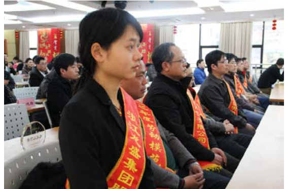
公司召开年度表彰大会表彰劳模、先进