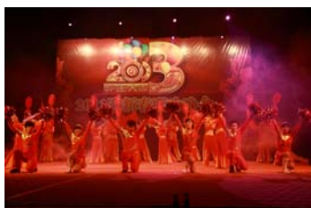
2013 年 2 月组织员工开展迎新春晚会活动