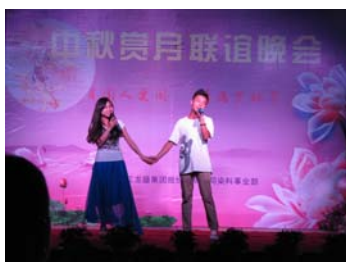
2013 年 9 月举办中秋赏月联谊会