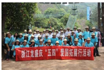
2013 年 5 月组织员工赴诸暨开展拓展活动