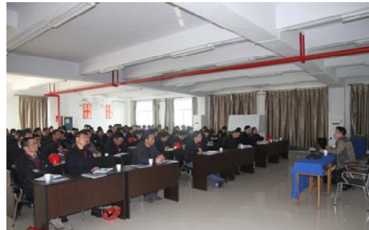
公司安全生产标准化培训活动