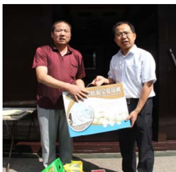
2013 年 7 月组织慰问困难党员