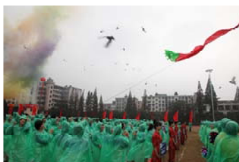
2013 年 11 月举办第二届职工运动会