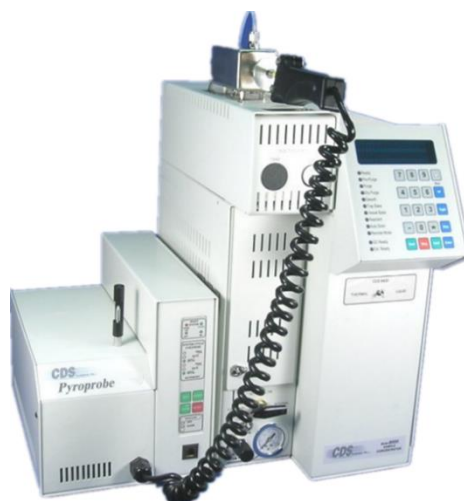
CDS 8000 系列产品

该系列产品将热裂解技术、热解吸技术和吹扫捕集技术整合在一套系统之内，与 GC/MS 联用，三种技术均以向 GC/MS 上样为目标，使用中可选择任一模式进行操作，应用方便。CDS 8000 充分利用自身所配的分析捕集阱强大的聚焦吸附、预加热和解吸等功能，将三种技术结合在一起，能在一套系统内完成三种典型 GC/MS 样品引入方式。