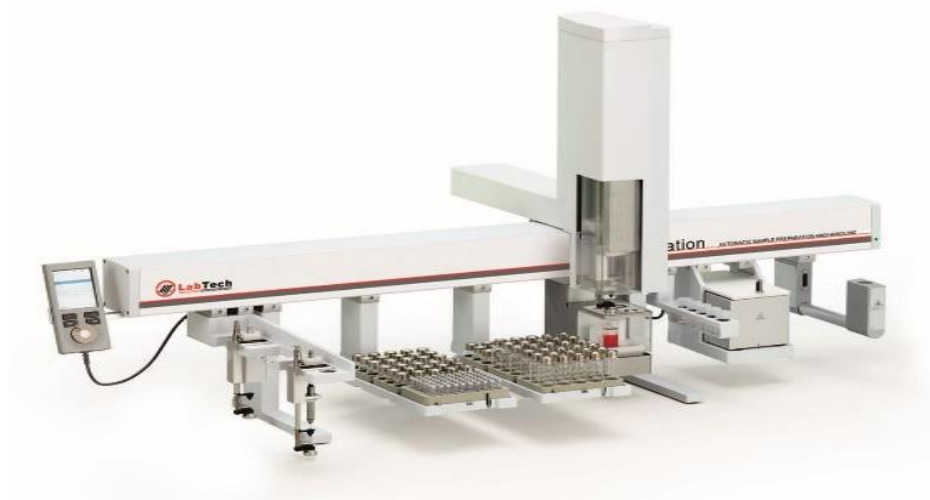
Astation 多功能样品前处理及进样平台

Astation 多功能样品前处理及进样平台可全自动完成复杂的液体处理、样品瓶移取、萃取柱移取等操作。可与固相萃取、微型凝胶渗析萃取净化、静态顶空、吹扫捕集、动态顶空等模块搭配使用。该平台可直接安装于气相色谱质谱仪上，并在样品处理完成后向气相色谱进样口直接上样。广泛用于各种物质中挥发-半挥发性有机化合物的全自动连续检测。平台中公司自主开发的微凝胶净化色谱模块 microGPC，能与微固相萃取 microSPE 模块联用，广泛应用于农药残留检测领域。