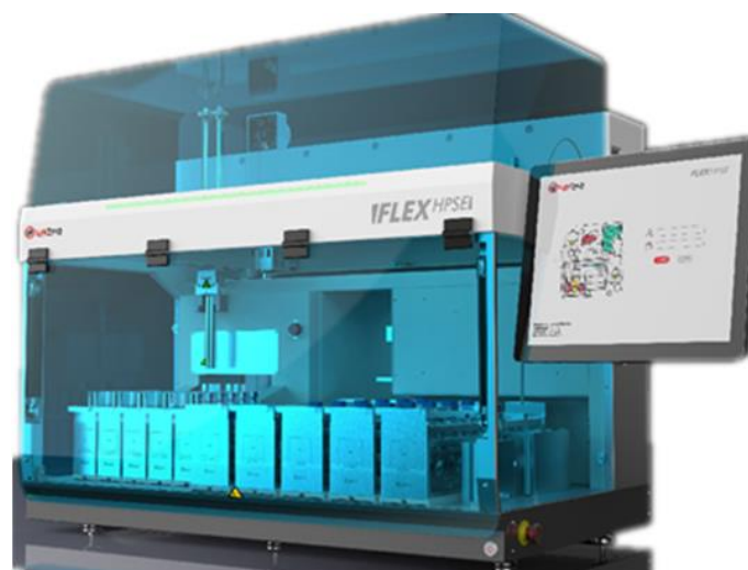
Flex-HPSE 全自动高效快速溶剂萃取仪

全自动高效快速溶剂萃取仪采用双通道并行设计，可同时萃取两个样品，运行效率是单通道的两倍。可连续萃取 30 位样品，XYZ 三维机械臂设计，样品可随时添加或取出，实验操作更加灵活，减少填罐和收集等待的时间。多种不同的