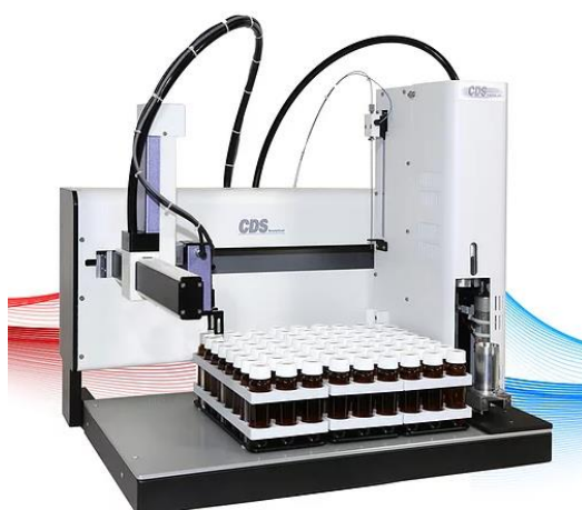
XYZ 低负载三维机械手抓取运动平台

该平台采用高精度伺服电机及控制器，XYZ 方向移动速度可达 0.5 米/秒，定位精度 0.3mm 范围内。平台采用气动式机械爪，最高可抓取质量高达 4kg 的物品。该平台应用于压力溶剂萃取装置，运动平台性能指标达到国内外主流厂家水平。硬件方面，采用成熟的国际化 XYZ 三维平台，通过机械爪自动抓取萃取罐放入加热炉中进行萃取，利用机械爪抓取收集工具，进行隔垫密封式收集，避免液体外溅及挥发。软件控制方面，可在工作运行过程中随时向仪器中添加已编辑的样品，而无需将所有样品装罐完成后一起放入，节省了填充萃取罐样品的时间。样品收集时，也可将单独的一排收集瓶取出进行后续操作，无需等待所有样品全部收集完成后再一并取出，节省实验等待时间。