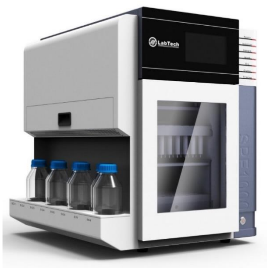
SPE1000 全自动高通量固相萃取仪

热裂解仪用于将高分子材料高温分解成气体，并用气相色谱质谱仪分析。应用领域包括汽车漆鉴别、建材涂料分析、烟草热解产物分析、艺术品鉴定等。热裂解产品曾用于为美国国家航空航天局火星探测器“好奇者”号上搭载的“火星样品分析模块”中的样品分析装置进行地面对照实验。