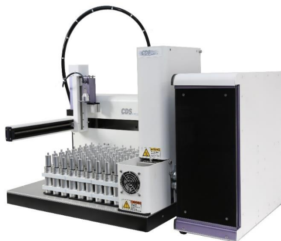
带有帕尔贴冷阱的二级热解吸仪

可全自动完成吸附管抓取检测、密封性检测、干吹扫、一级解吸、二级预解吸、和二级解吸等全部操作。可在无人值守的情况下连续处理大量样品。