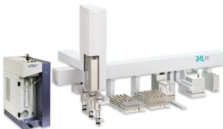
Astation-7000C 全自动在线吹扫捕集系统

可全自动完成吸附管抓取检测、密封性检测、干吹扫、一级解吸、二级预解吸、和二级解吸等全部操作。可在无人值守的情况下连续处理大量样品。