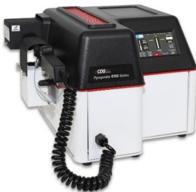
CDS 6200 型 Pyroprobe

萃取罐和收集瓶搭配可用，与平行浓缩仪及旋转蒸发仪的样品瓶通用，无需转移样品，直接进行后续浓缩操作。平台采用封闭平台式设计，自带通风系统，避免实验人员与有害试剂直接接触，可实时观测仪器的运行状态。