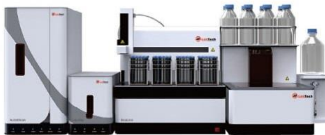
GVS 凝胶净化-定量浓缩-固相萃取三联机系统

由固相萃取（S）、凝胶净化（G）和定量浓缩（V）三部分构成，能大量连续自动地处理样品，实现了二维（分子尺寸和极性）分离的全面自动化，不需要中间样品转移。主要应用于科学研究和物质分析中分离化学聚合物和小分子的检测。