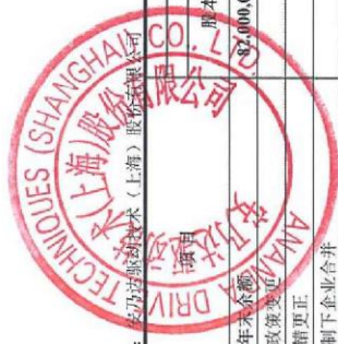
合并所有者权益变动表