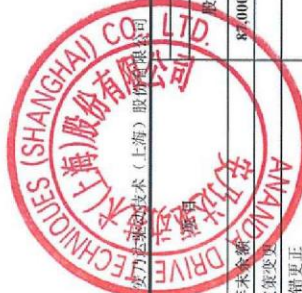
合并所有者权益变动表