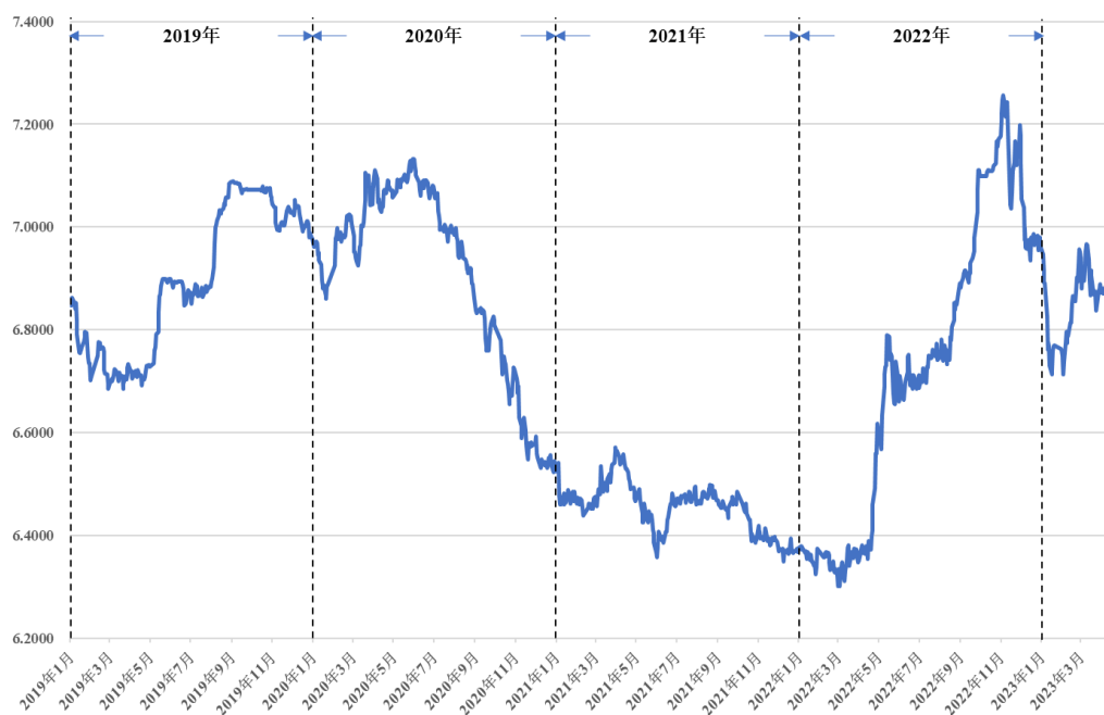
2019 年以来美元兑人民币中间价走势

自 2015 年“811 汇改”后，2016 年至 2019 年，美元兑人民币汇率平均值为 6.73，如上所述，2021 年美元兑人民币汇率较低使得公司的盈利空间减小。自 2022 年 5 月起，受国内经济环境波动、结售汇意愿以及美联储加息影响，人民币相对于美元发生一定程度的贬值，2022 年全年美元兑人民币平均汇率达 6.73，已基本恢复至 2019 年水平。美元兑人民币汇率的上升，一方面带动了公司外销业务毛利率提升；另一方面，公司期末应收账款主要由以美元等外币计价的应收账款构成，人民币贬值为公司带来了汇兑收益。