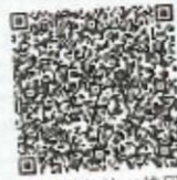
黄灵丹年检二维码

本证书经检验合格, 继续有效一年。 This certificate is valid for another year after this renewal.