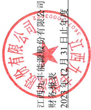
母公司股东权益变动表(续)