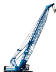
增程式电动强夯机