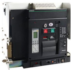
低压智能型万能式断路器