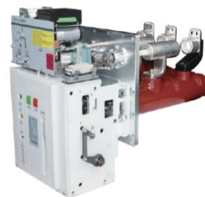
中压 C-GIS 专用真空断路器

随着我国新型城镇化、工业转型升级、农业现代化和电力改革持续推进，新能源、智能电网、智慧城市、物联网、分布式能源、电动汽车和储能装置等行业快速发展，终端用电负荷呈现增长快、变化大、多样化的新趋势，将加快配电网改造升级的需求释放。