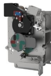
环网柜组合电器单元操作机构