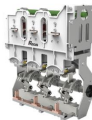
环网柜断路器单元开关