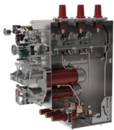
环网柜组合电器单元气箱