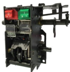
低压断路器操作机构

公司主要从事以断路器、环网柜为代表的中低压配电设备及其关键部附件的研发、生产和销售，是目前我国中低压配电设备及关键部附件行业中研发、生产、服务能力位于前列的企业之一。公司产品主要用于电力系统的配电设施，包括低压及中低压断路器配套用框（抽）架、操作机构、附件和智能环网柜及智能环网柜的断路器单元操作机构及开关、负荷开关单元操作机构及开关、组合电器单元操作机构及开关等。