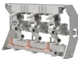
环网柜负荷开关单元开关