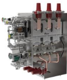
环网柜断路器单元气箱