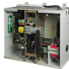
中压断路器操作机构