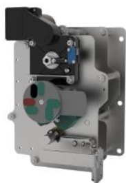
环网柜负荷开关单元操作机构