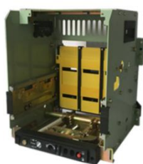
低压断路器框（抽）架