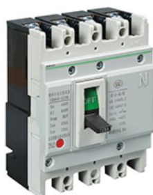
低压塑料外壳式断路器