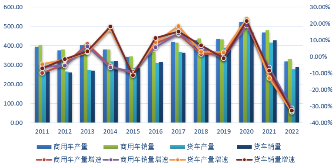
图1 2011年-2022年我国商用车、货车产销量及增速 单位：万辆

2018年，各地区各部门认真贯彻落实党中央国务院决策部署，按照推动高质量发展要求，深入推进供给侧结构性改革，积极落实稳就业、稳金融、稳外贸、稳投资政策，经济运行在合理区间，继续保持总体平稳、稳中有进发展态势。全年共产销商用车427.98万辆和437.08万辆，同比增长1.69%和5.05%。