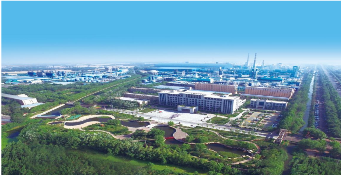
（图片所示：公司齐河工厂）

金能科技是一家资源综合利用型、经济循环式的综合性化工企业，在齐河和青岛建有两大生产基地，业务涉及精细化工、煤化工、石油化工三大板块。主要产品有焦炭、炭黑、丙烯、聚丙烯、山梨酸（钾）等。公司建有国家级企业技术中心和国家级实验室，是“资源高效、绿色低碳”循环发展的典范，属国家高新技术企业，连续多年跻身中国石油和化工企业 500 强，先后荣获“全国技术创新型煤化工企业”“国家绿色工厂”“国际热电联产奖”等多项荣誉称号。