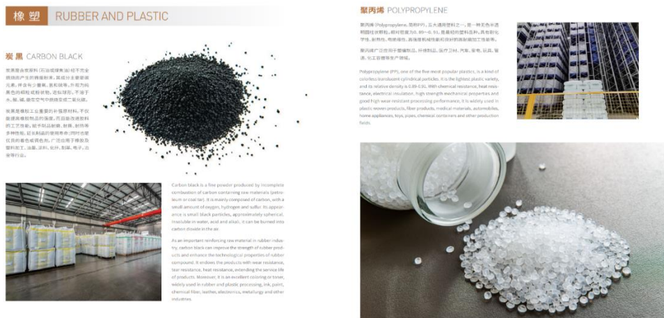
(图片所示：公司炭黑、聚丙烯产品)

炭黑是我国现代经济中不可缺少的重要功能材料之一，主要应用于橡胶行业，其中下游用于轮胎领域的占比约 70%以上。因此，炭黑市场与轮胎市场、汽车市场的景气度密切相关。随着我国汽车产业的不断发展，新能源的应用方兴未艾，预计市场未来对炭黑的需求将不断增长。