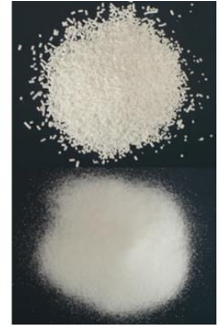
（图片所示：公司酸钾产品）