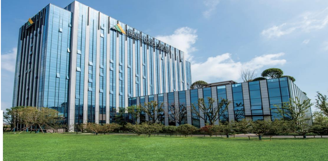
（图片所示：公司青岛办公区）

金能化学（齐河）新上 4 万吨/年山梨酸钾项目正按计划推进建设，项目是金能公司为进一步延伸产业链条，提高综合竞争力的重要举措，主要建设年产 3 万吨乙醛、2 万吨巴豆醛、3 万吨山梨酸、4 万吨山梨酸钾生产装置。