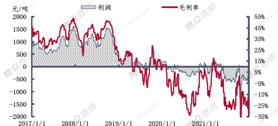
图 10 2017-2021 年中国煤制甲醇成本利润趋势变化图

2017-2021 年中国煤制甲醇利润呈现逐渐亏损状态，由于近年来中澳贸易，澳煤停止进口，目前外进与国产煤无法满足国内需求，使得国内煤炭价格大幅上涨，尤其进入 2021 年后，国家为努力争取 2030 年前实现碳达峰，采取限电、及能源平衡等双控措施，使得煤炭价格大幅上涨，截止 2021 年 10 月，煤炭价格涨幅突破 1000 元/吨。在成本强劲支撑下，与煤炭价格相较，虽甲醇价格有所上涨，但在高成本压制下，目前煤制甲醇仍处于亏损状态。