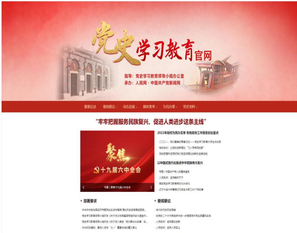
党史学习教育官网页面截图

2、着力做好重大主题宣传报道。围绕建党百年、全面建成小康社会、党的十九届六中全会、党史学习教育等重大主题，人民网及早策划，精心报道，不断提高和释放优质内容生产力。2021年，人民网承办党史学习教育官网官微、庆祝建党百年新闻中心官网官微，与教育部等部门合作开设“同上一堂思政大课”，推出“我和我的信仰”大型融媒传播活动，与国内百余家红色展馆和主题教育基地合作打造“红色云展厅”。2021年，党史学习教育官方微信粉丝总数达850万；“全国党史知识竞赛”累计关注量达8.86亿人次；全国大学生“同上一堂思政大课”观看量超过1.5亿次；“我和我的信仰”相关话题阅读量累计超过3亿；“红色云展厅”