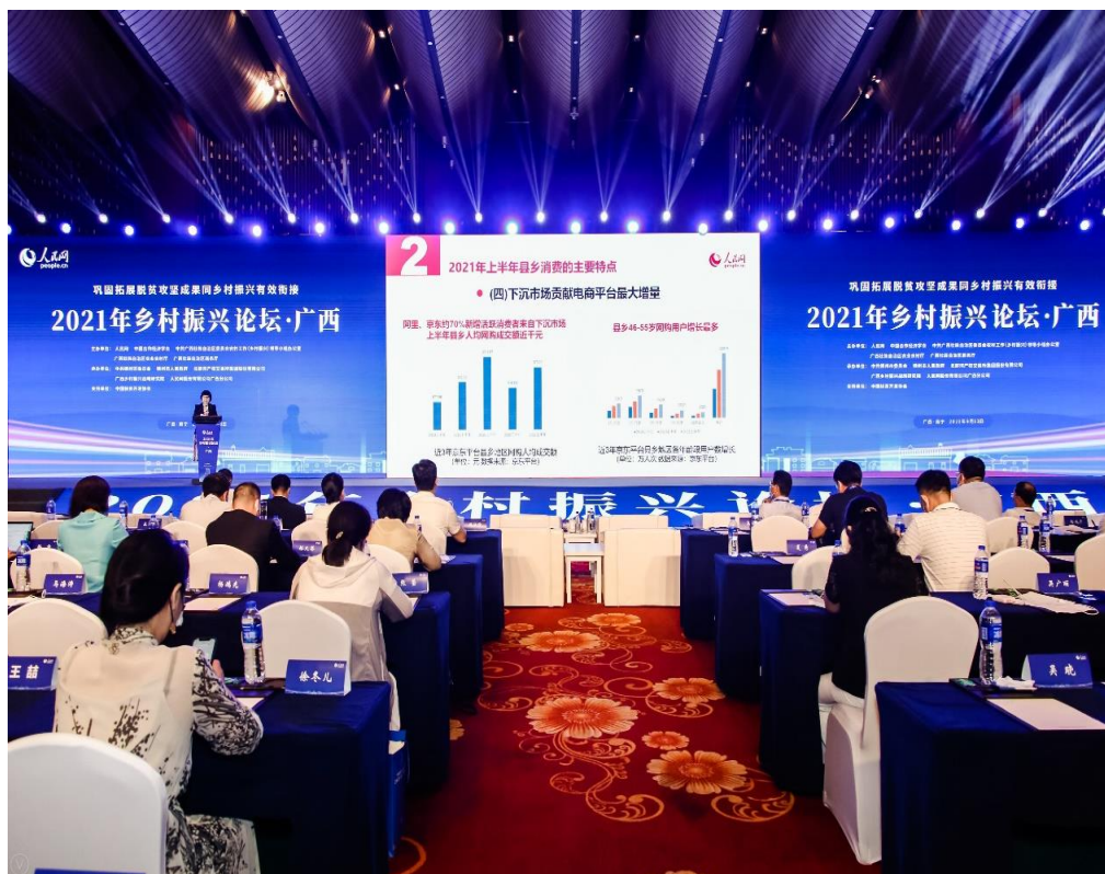
人民网广西分公司承办的“2021年乡村振兴论坛·广西”活动现场

语种创意海报作品《26个字母看中国脱贫制胜密码》对我国脱贫攻坚战胜利进行“大揭秘”，获得外交部高度肯定，并被多家平台转发。