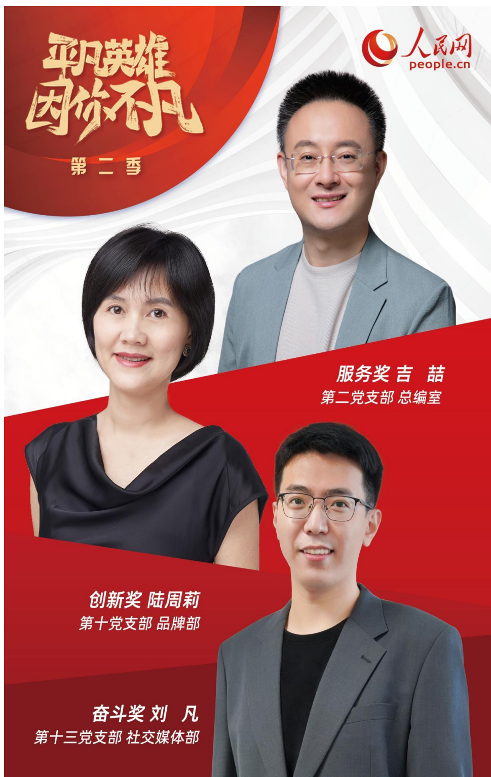
人民网开展“平凡英雄”争创活动

2021年，人民网不断加强新闻职业道德建设，严防虚假新闻，禁止有偿新闻，始终坚持正确的舆论导向、价值取向；积极开展新闻舆论工作制度及新闻工作者从业规范的培训