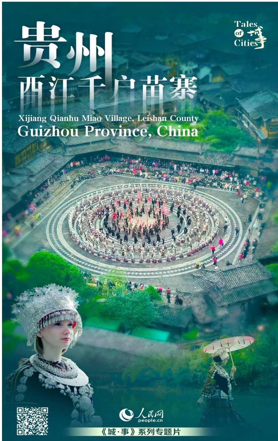
8 集系列融媒体作品《Tales of Cities（中国“城·事”）》 获第 31 届中国新闻奖三等奖