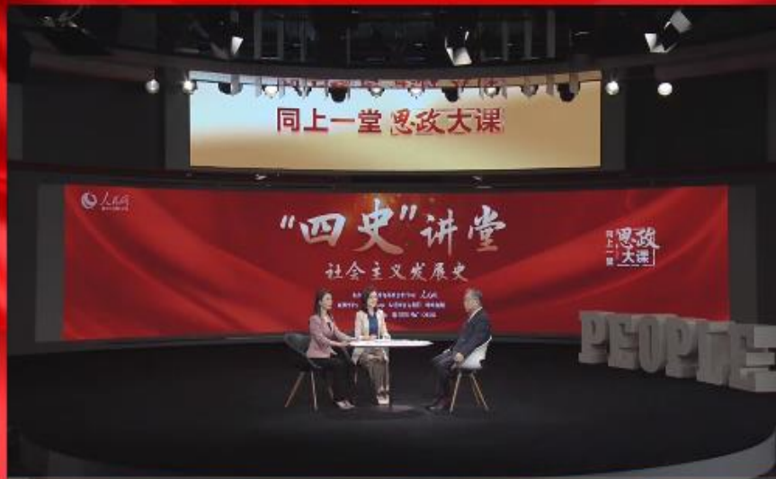
同上一堂“四史”思政大课页面截图