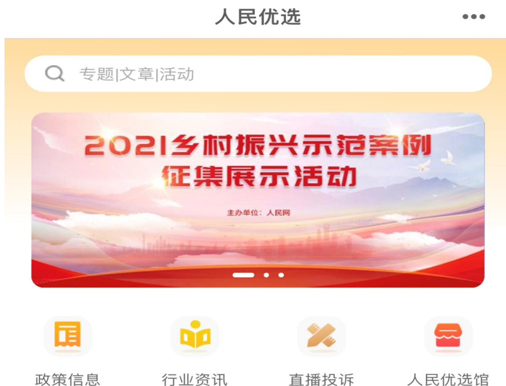
“人民优选”平台截图

人民网地方分公司举办多场助力地方乡村振兴活动。人民网广西分公司承办“2021年乡村振兴论坛·广西”，邀请了农业农村部相关司局的负责同志，和部分省（区）农业农村行政主管部门，共同探讨科学有序推动乡村产业、人才、文化、生态和组织振兴，助力新时代“三农”工作开好局、起好步。人民网海南分公司策划组织“乡村振兴”系列推介活动，推介和宣传海南在乡村振兴工作中有产业特色和取得较好成绩的市县、优秀驻村干部、产业带头人等等。认真贯彻党中央关于“脱贫攻坚不仅要做得好，而且要讲得好”的要求，依托主流媒体采编优势，深入开展宣传报道，其中，多