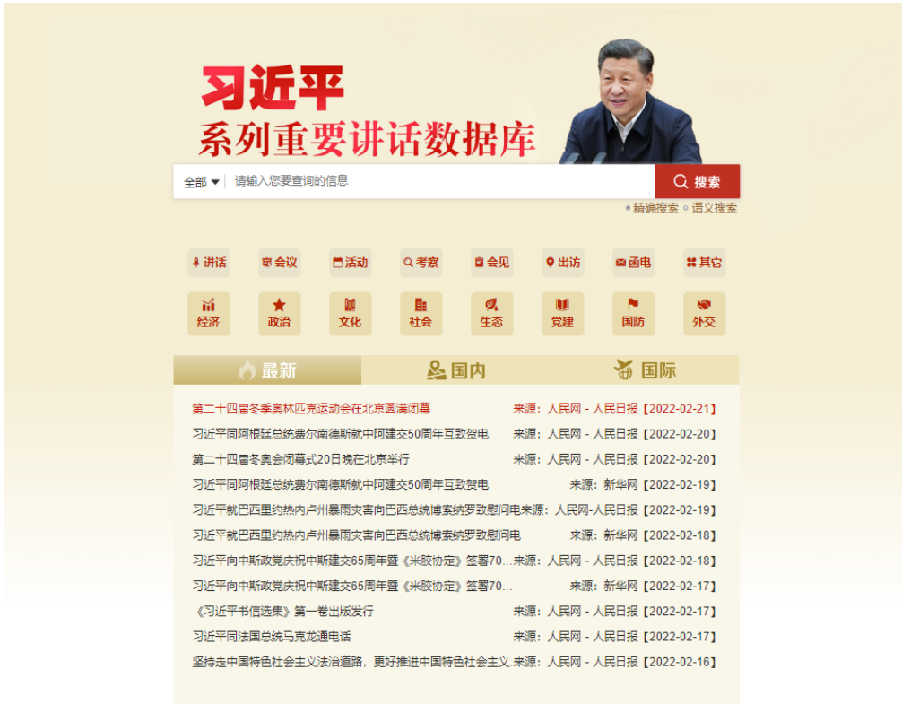
“习近平系列重要讲话数据库”页面截图

1、高质高效完成首要政治任务。2021年，人民网始终把报道好习近平总书记和宣传阐释好习近平新时代中国特色社会主义思想，作为首要政治任务和最重要的政治责任。报告期内，人民网在重点位置推出习近平总书记重要活动、重要讲话报道及解读稿件 5400 余条次，364 篇原创报道被各大网站置顶转发。“习近平系列重要讲话数据库”不断优化升级，累计收录讲话、报道等 11847 篇，累计访问量逾 8.8 亿人次，日均查询量逾 68 万人次。同时，精心做好总书记报道的国际传播，通过 12 个外文语种网站和国际主流社交媒体平台累计发布总书记报道 2.6 万条次。