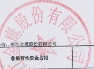
非经营性资金占用及其他关联资金往来情况汇总表 2020年度