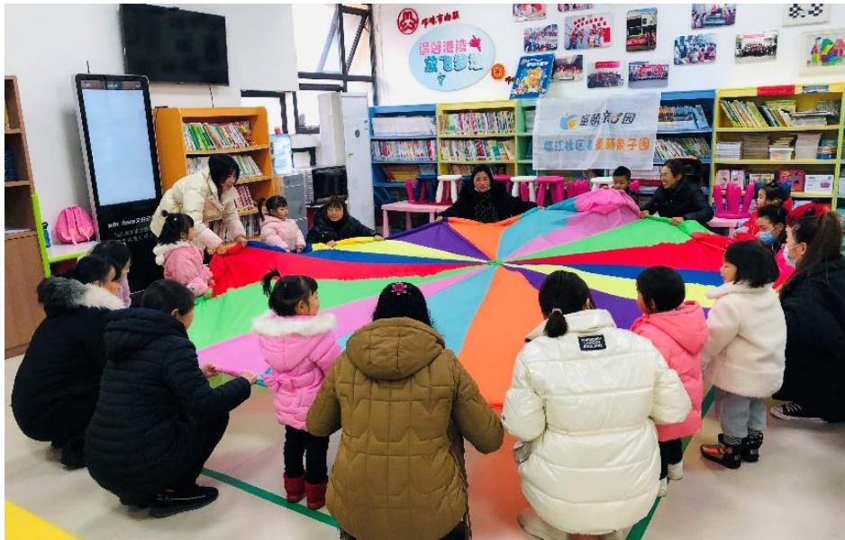
县域服务点服务掠影

赋能幼儿家长的儿童早期发展服务： 与上海闵行区活力社区服务中心合作，总结其多年的处境不利儿童早期发展社区服务经验，使贫困家庭儿童获得的公益性早期发展服务得到提升。上海闵行区活力社区服务中心的儿童早期发展服务亮点在于面向城市流动儿童以及农村留守儿童提供 0-3 岁早期发展服务，赋能家长，在提升养育人的养育