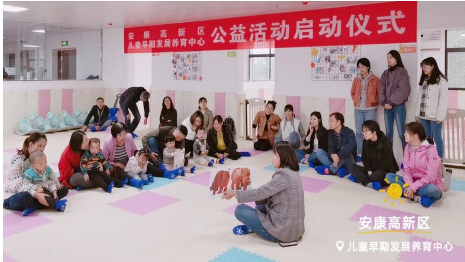
职业学校儿童早期发展实践基地培训

幼儿及其家庭间接受益。2020 年项目共投入 30 万元。项目累计投入已达 120 万元。