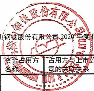
附表：马鞍山钢铁股份有限公司2020年度非经营性资金占用及其他关联资金往来情况汇总表(续)