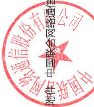
附件 中国联合网络通信股份有限公司 2020 年度非经营性资金占用及其他关联资金往来情况汇总表