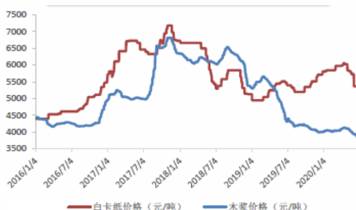
图 1: 白卡纸价格趋势

高于木浆价格的走势。由于粤华包没有纸浆生产线，与其他白卡纸企业相比，浆价波动对其影响更大。