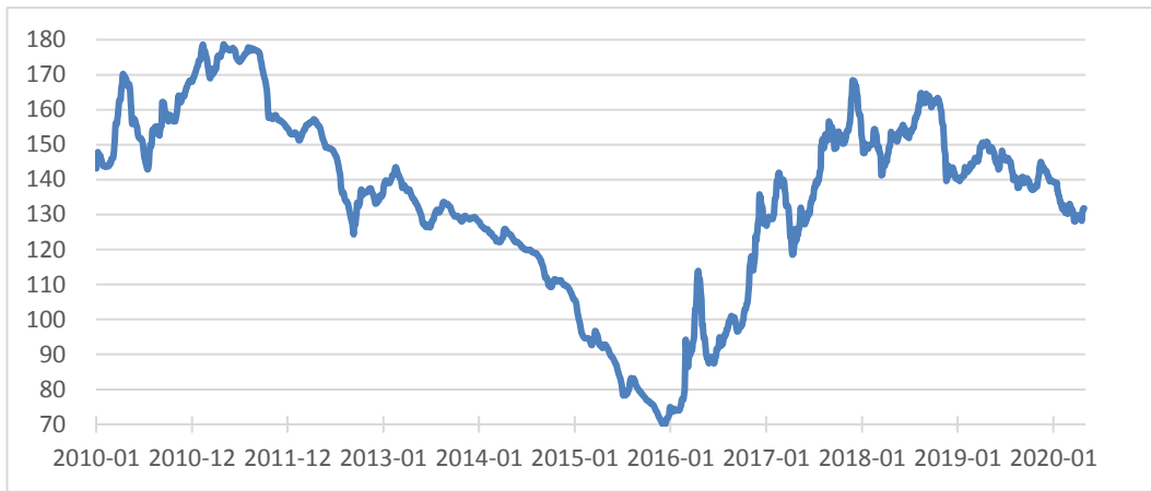
图2 近年来钢材综合价格指数