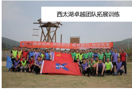
西太湖卓越团队拓展训练