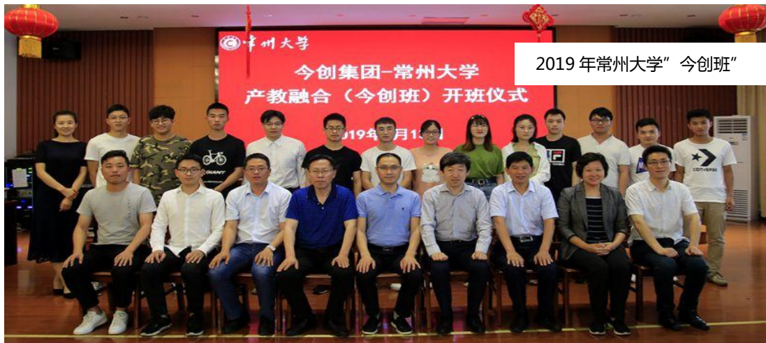
2019年常州大学“今创班”

报告期内，公司不断完善人才培养机制，根据不同层次的人才特点，坚持全面培训和重点培养项目相结合的模式。全年共开展各类培训 1510 班次，31167 人次，人均培训课时 22.3h，完善公司级培训和部门级培训课程体系，内容涵盖业务技能、安全生产、管理能力提升等，培训计划完成率 100%，为公司员工发展和晋升提供支持。