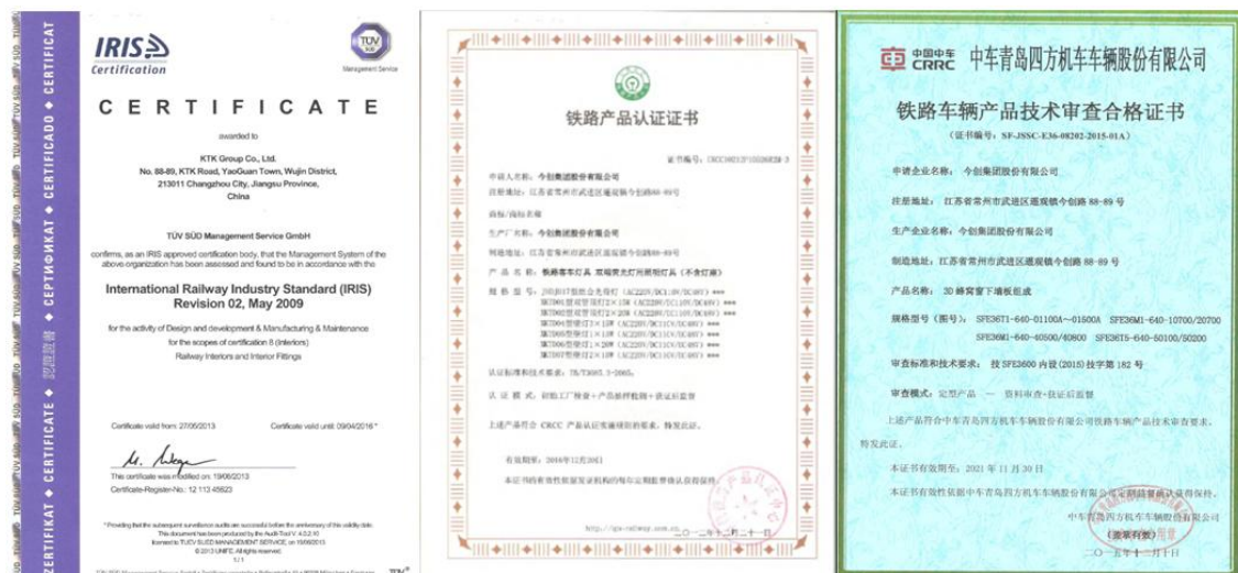
IRIS、CRCC 及客户技术审查合格证书

公司产品应用于轨道交通车辆行业，服务于人们的日常出行，产品的综合性能必须经得起最严苛的考验。按照 IRIS 和 RAMS（可靠性 Reliability、可用性 Availability、可维修性 Maintainability 和安全性 Safety）体系的要求以及 CRCC 铁路产品认证实施规则和铁路总公司质量安全防护体系的要求，公司的产品经过充分的设计论证、检验、测试，才能上车运行，力争为公众提供安全舒适的产品。公司积极进行安全体系标准化的推行，获得了客户的广泛认可。