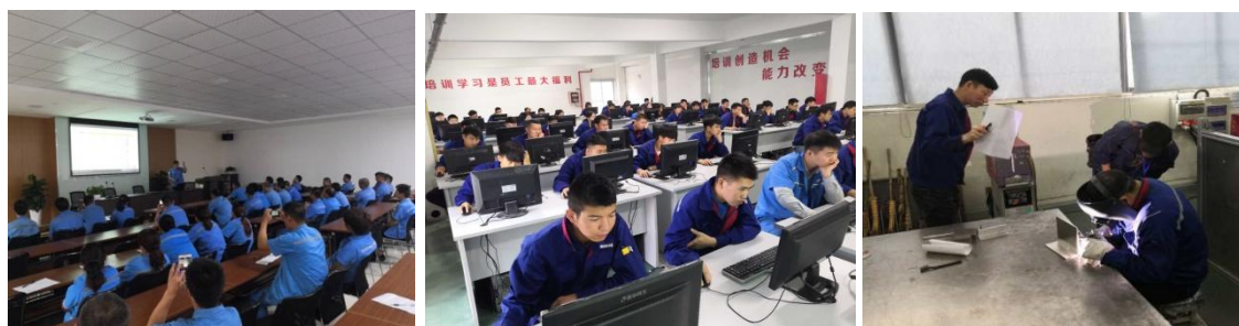
图：一线员工技能评定

公司实行员工工作绩效评价，从劳动纪律、工作能力、工作业绩等多方面对员工进行考评，形成准确、有效的客观评价。持续完善薪酬体系，对管理/技术人员、一线生产岗位人员等不同岗位实行不同的薪酬激励政策，实现薪酬分配与管理的分类、分层的制度化、规范化管控。