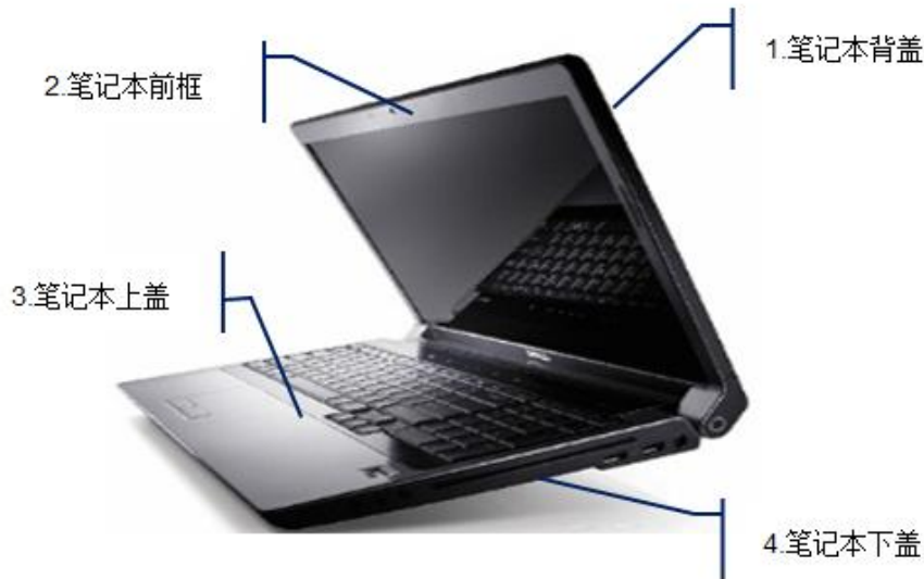
图：笔记本外壳示意图

公司为主流消费电子产品厂商提供精密结构件模组产品，其中以笔记本电脑结构件模组为主。笔记本电脑结构件模组包括四大件：背盖、前框、上盖、下盖以及金属支架，上述结构件模组在装配笔记本电脑过程中需容纳显示面板、各类电子元器件、转轴等部件，其结构性能对制造精密度提出了较高的要求。同时由于其还具有外观装饰功能，故该类产品对生产企业的设计能力亦有较高的要求。