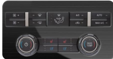
福特汽车空调控制系统