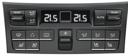
保时捷汽车空调控制系统