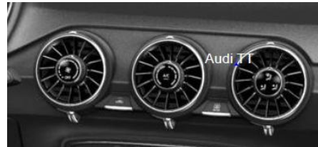
奥迪空调控制系统 (Audi TT)