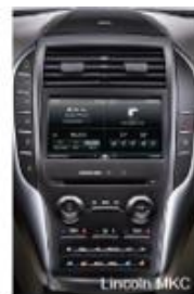
中控面板 (Lincoln MKC)