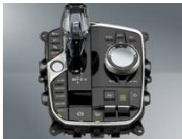
中央控制系统 (宝马 X5/X6/X7)