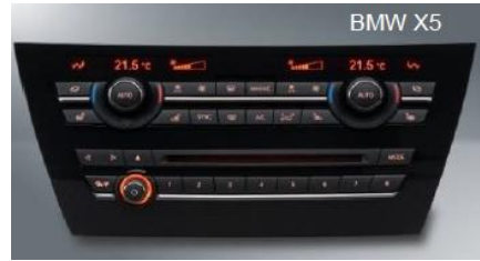
宝马汽车空调控制系统 (BMW X5)