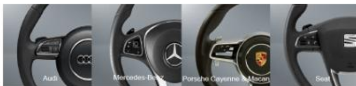
多功能方向盘开关