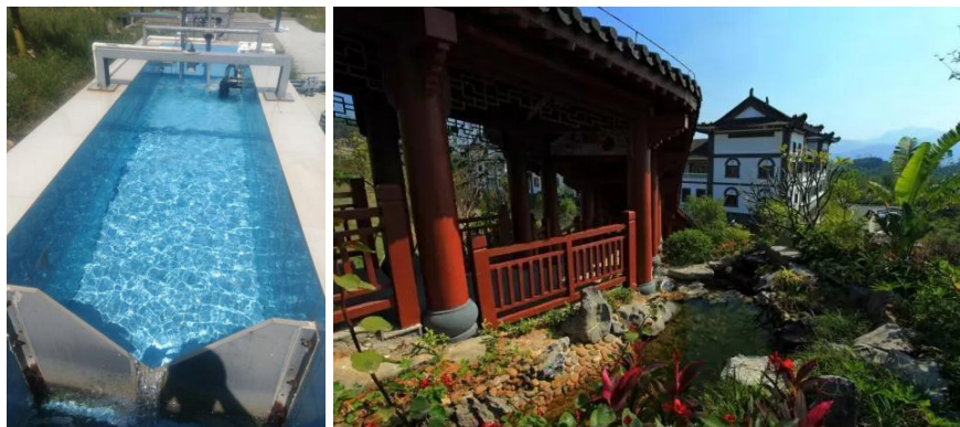
惠州项目废水处理设施及园区绿化

管网的污水量。同时通过技术改造，增加浓水再处理系统（DTRO），进一步降低浓水产生量，本集团部分项目如位于惠州的惠阳环保园、通州等公司均已达到“污水零排放”。