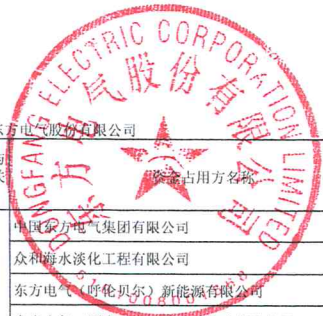
东方电气股份有限公司2019年度非经营性资金占用及其他关联资金往来情况汇总表