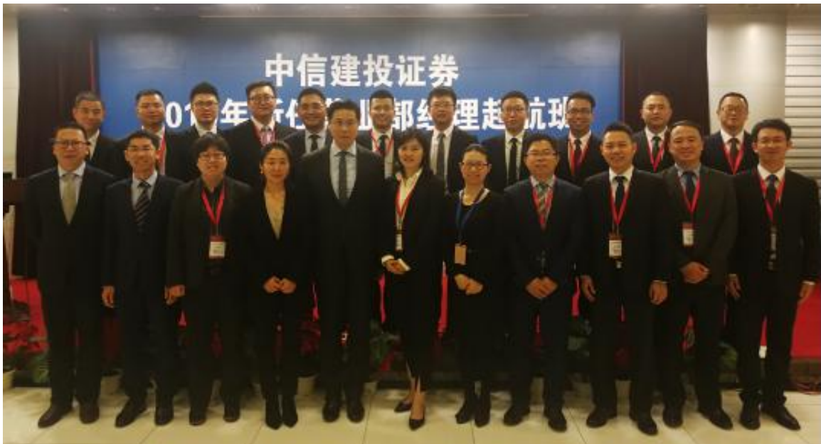
图 5：2019 年中信建投证券新任营业部经理“起航班”

2019年4月举办了2019年新任营业部经理“起航班”，来自全国的20位新任或拟任营业部经理参加了为期四天的集中学习。