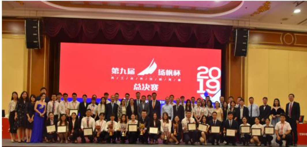
图 6：2019 年中信建投证券“扬帆杯”竞赛