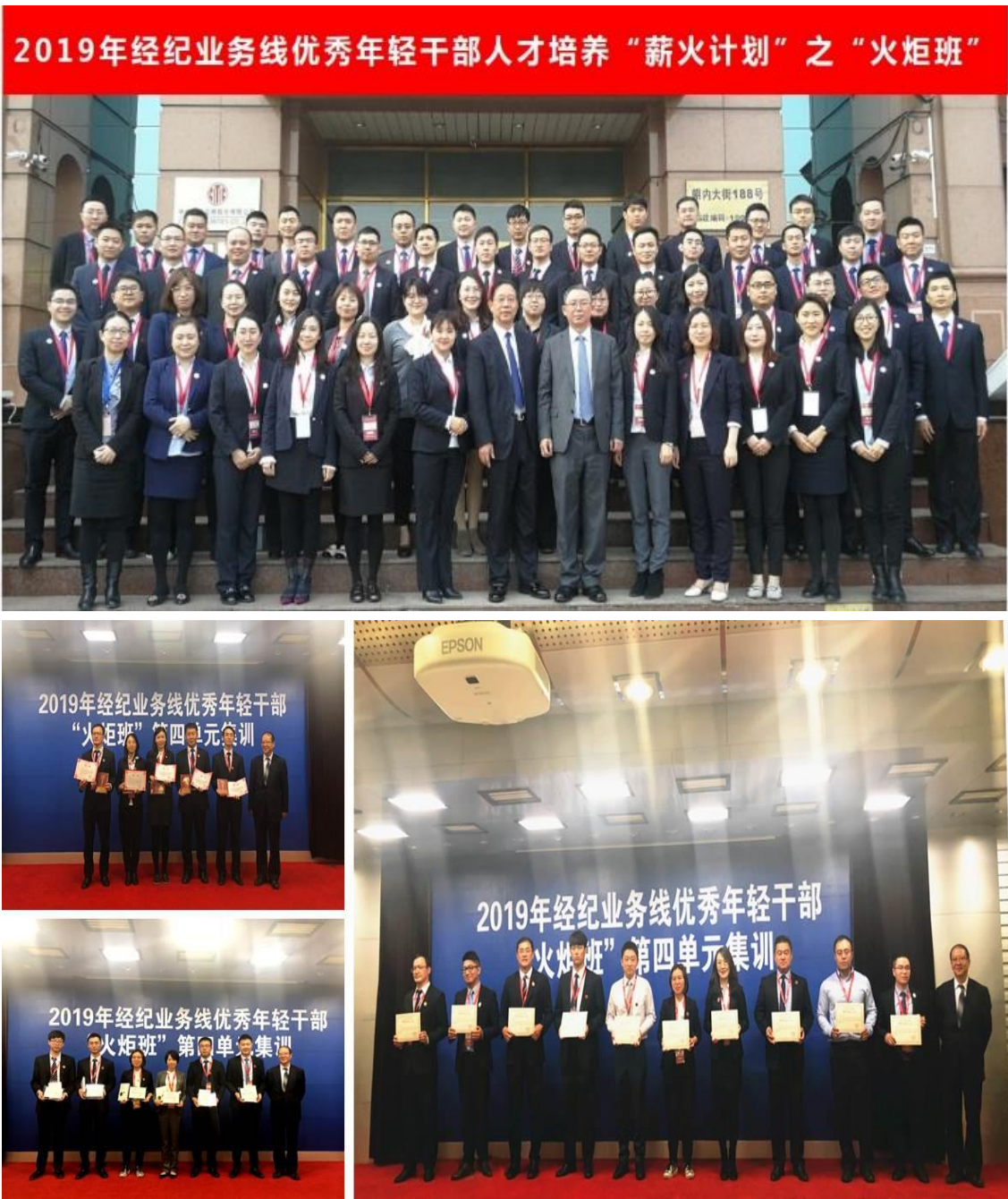
图 4：2019 年中信建投证券经纪业务线优秀年轻干部人才培养“火炬班”