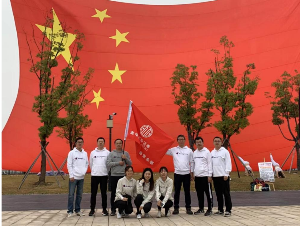
图 7：2019 年中信建投证券“不忘初心、牢记使命”主题健步走