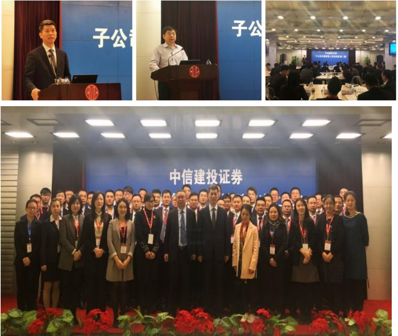
图 3：中信建投证券子公司中层管理人员培训班