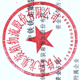
编制单位：中铁路集装箱物流股份有限公司 2019年度非经营性资金占用及其他关联资金往来情况汇总表