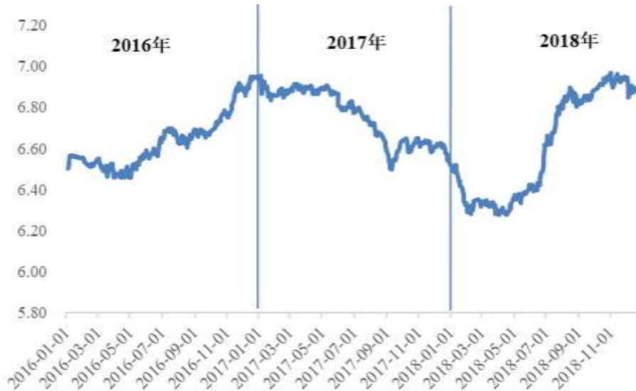
2016 至 2018 年 100 日元兑人民币中间价变化情况