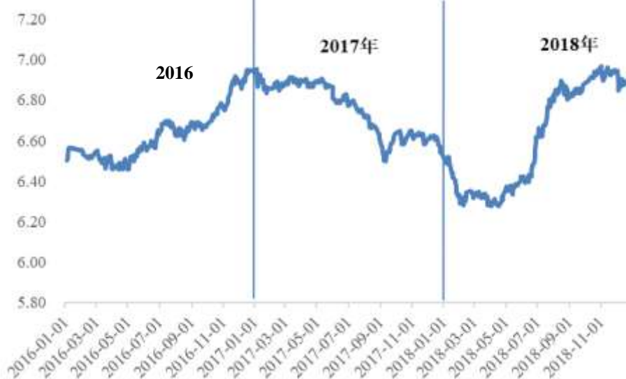
2016 至 2018 年美元兑人民币中间价变化情况