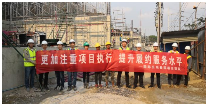
泰国 LPG 变站总包项目