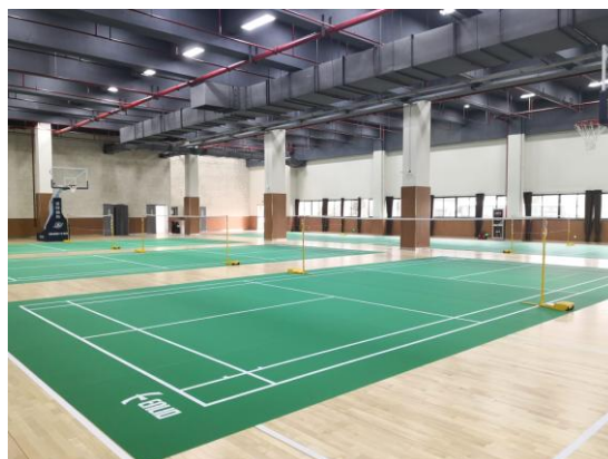
职工室内活动中心

员工文体活动精彩纷呈。 结合职工群众的精神文化需求，从原来的“十会一社”扩展到 13 个协会，完成了协会改选工作，在南京建设总会的基础上，在北京、安徽等地区建立分协会，健全文体协会管理和工作机制，让每位职工都能参与到工会活动中来。坚持特色化、小型化、多样化的原则，组织开展“继远电网杯”乒乓球比赛、“迎春送福送对联”等职工群众易于参与、便于参与、喜闻乐见的文体活动，积极参加公司“卓越杯”职工足球联赛、江苏省第十九届职工运动会，用精彩纷呈的职工文化建设成果促进优秀企业文化落地。