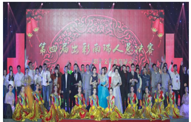
第四届“出彩南瑞人”展示活动