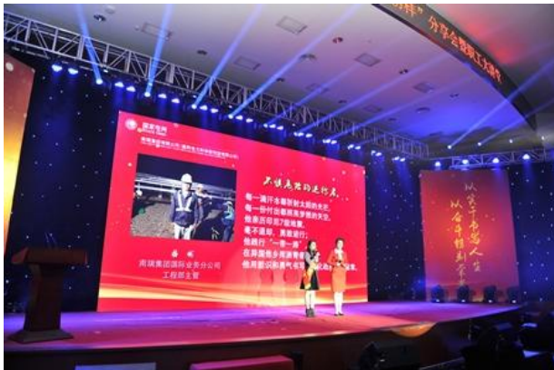
第四届“身边的榜样”分享会

深化“巾帼建功”系列活动,评选表彰了12个巾帼建功示范岗和10位巾帼建功标兵以及优秀女职工,在女职工中树立先进典型,以点带面,激励女职工建功立业。