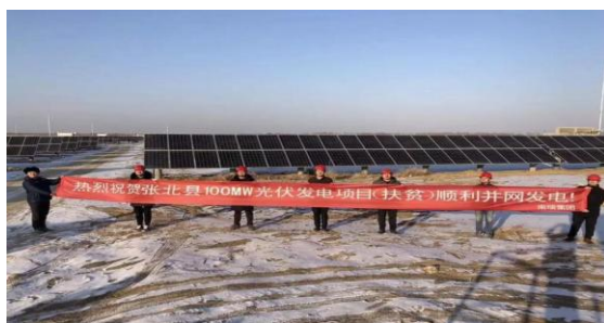
承建的张北县100MW光伏发电扶贫项目

2018年，国电南瑞圆满完成张北县100MW光伏发电扶贫项目，这也是国电南瑞迄今承担的最大规模的EPC总包光伏项目。项目年发电量约14.7万MWh，预计25年总发电量约为368万MWh。每年可节约标准煤12.5万吨，减少二氧化碳排放约36.8万吨、二氧化硫等有害气体排放约1152.6吨。项目建成前三年收益捐赠给当地政府，以帮助县内建档的贫困户脱贫。项目建设对推广类似扶贫模式具有示范效应。