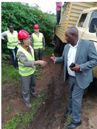
在肯尼亚协助村民修理被大水冲垮的桥梁