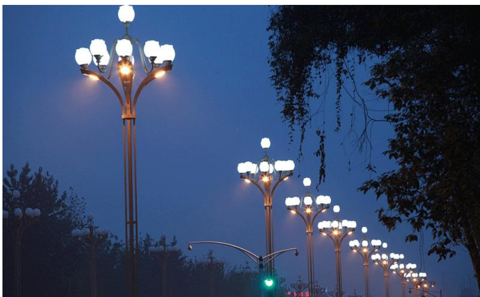
文化定制代表作：中华芙蓉灯