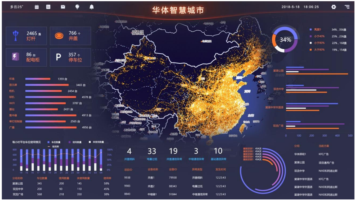
智慧路灯综合管理软件平台