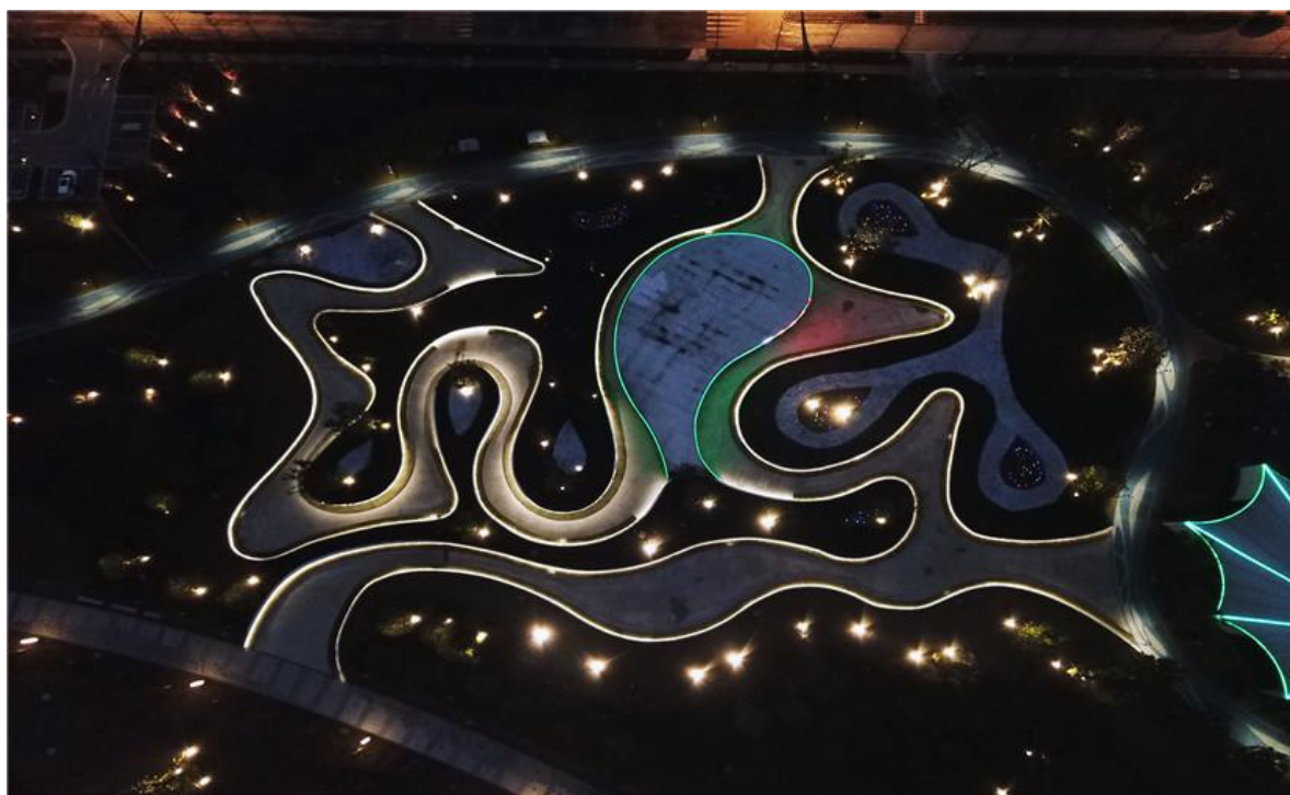
遂宁河东新区亮化项目

华体科技全资子公司华体安装在景观照明工程领域聚集了行业高端人才，在此环境下，景观照明工程将是公司业绩强有力的增长点。