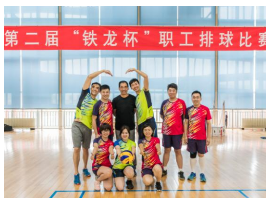
图 3.4 第二届职工排球赛