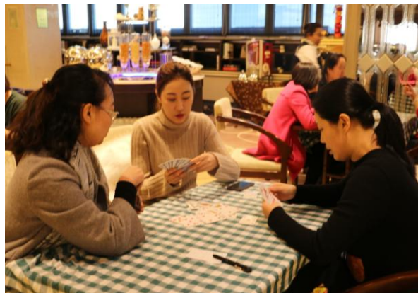
图 3.8 职工扑克比赛

在保证安全的基础上，公司举办了羽毛球、乒乓球、排球、扑克、摄影、朗诵等多姿多彩的文体竞赛和徒步、运动会等集体活动，不仅丰富了员工的生活，也给员工提供展示自我的舞台。