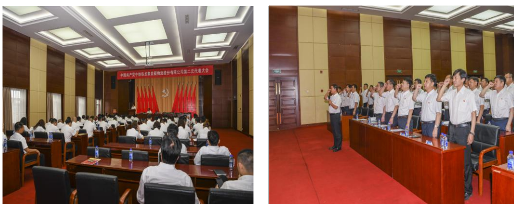
图 3.10、3.11 公司第二届党代会