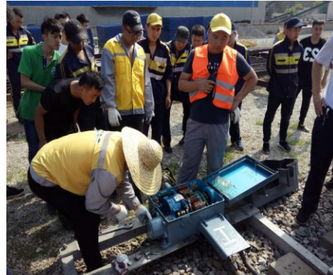
图 3.7 技能竞赛现场