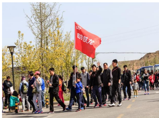
图 3.3 职工健步行