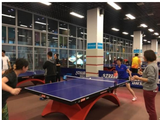
图 3.1 乒乓球赛

为公司 1397 名职工缴纳了大连市医疗互助金，帮困 134 人次，共计 11.5 万元；助学 24 人次，共计 4.32 万元；医疗救助 83 人次，共计 45.7 万元；对 2 名特困职工实施创业资金援助 10 万元。加强团员青年岗位培训和业务知识教育。有针对性地开展保安全、当标兵等活动，发挥好团员青年生力军和突击队作用。