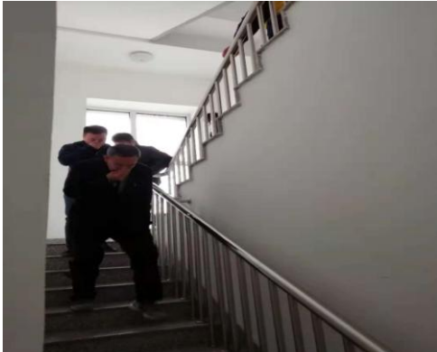
3.6 火灾事故应急预案演练