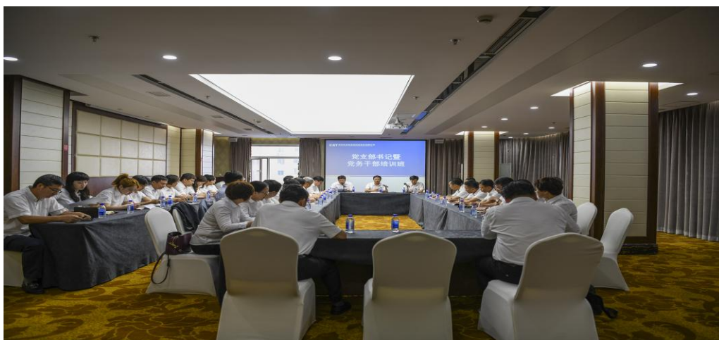
图 3.9 党务干部培训

深入开展“三重”党日及庆祝建党 97 周年系列活动，唤醒党员入党初心。组织党员教育活动。每名党员结合实际，按照“一岗一标”，确定合格党员标准，全体党员的党性意识、党员意识和政治素质得到不断加强。