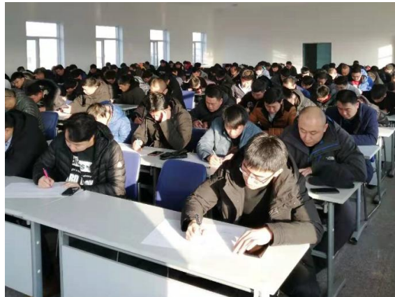
3.5 员工理论培训及考核

沙鲮铁路分公司拥有最多数量的一线员工和复杂繁重的现场作业需求，其在2018年培训工作方面延续着一如既往的严谨、严肃、严格的作风。根据新职、转岗、晋升员工拟任职务培训需求，依据相关行业规定和公司制度，沙鲮公司全年进行岗前安全教育和理论培训160人次，安全考试全部合格，同时签订师徒合同进行现场实作培训，保证员工“理论”和“实操”的双重安全武装；为保证铁路岗位员工达到岗位任职要求，及时、积极与路局职业技能鉴定站联系、申请，在路局鉴定站的大力支持下，2018年先后分2批，117名员工参加职业技能鉴定考试考核，全部合格；对于新技术、新设备、新规章、新工艺开展专项“四新知识”培训，确保技术领先、操作安全、制度规章落实到位。中铁铁龙集装箱物流股份有限公司员工培训情况如表3.5所示。