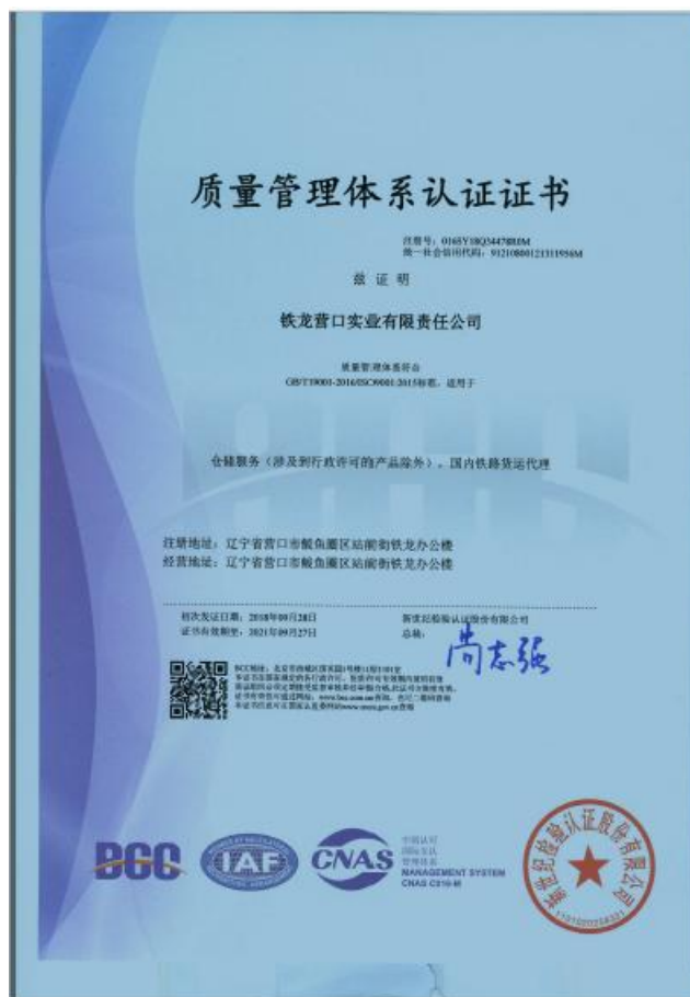
质量管理体系认证证书