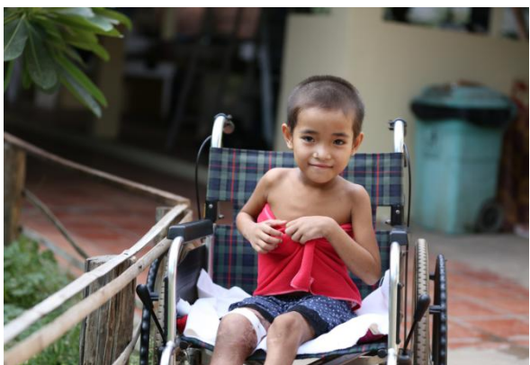
柬埔寨吴哥儿童医院受益儿童