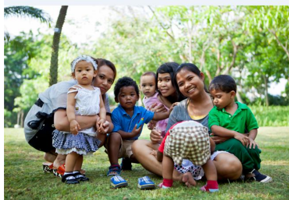
香港NGO活动受益儿童