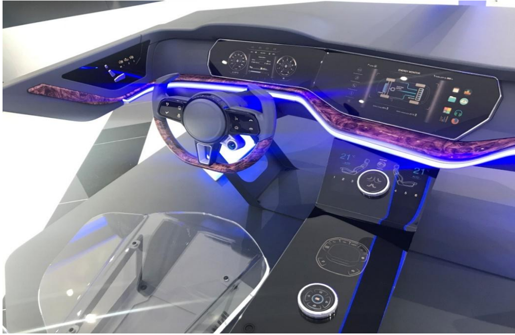
均胜智能驾驶舱概念产品

公司最新推出的智能座舱系统，结合了仪表盘、车载信息娱乐系统、人机交互系统，软件系统和数据服务等模块，未来还能进一步与安全系统融合。此外，随着网联化的普及，公司在 V2X 领域也正在加紧研发相关技术方案，以完善车联网功能。与大唐集团旗下的辰芯科技有限公司也在今年 5 月签署战略合作协议，联手发力汽车智能车联技术，打造新一代 TBOX 和 V2X 车用电子产品。通过合作，公司参与国家 V2X 车联网相关标准制定也迈出了实质性的一步。