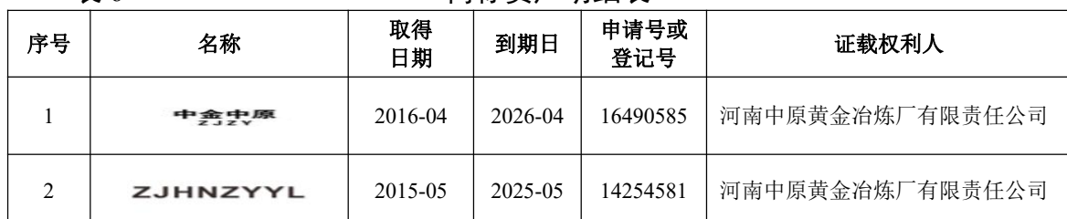
表 6 商标资产明细表

4、截至基准日 2018 年 4 月 30 日，企业申报评估的账面未记录的 3 项商标资产，具体情况如下表：