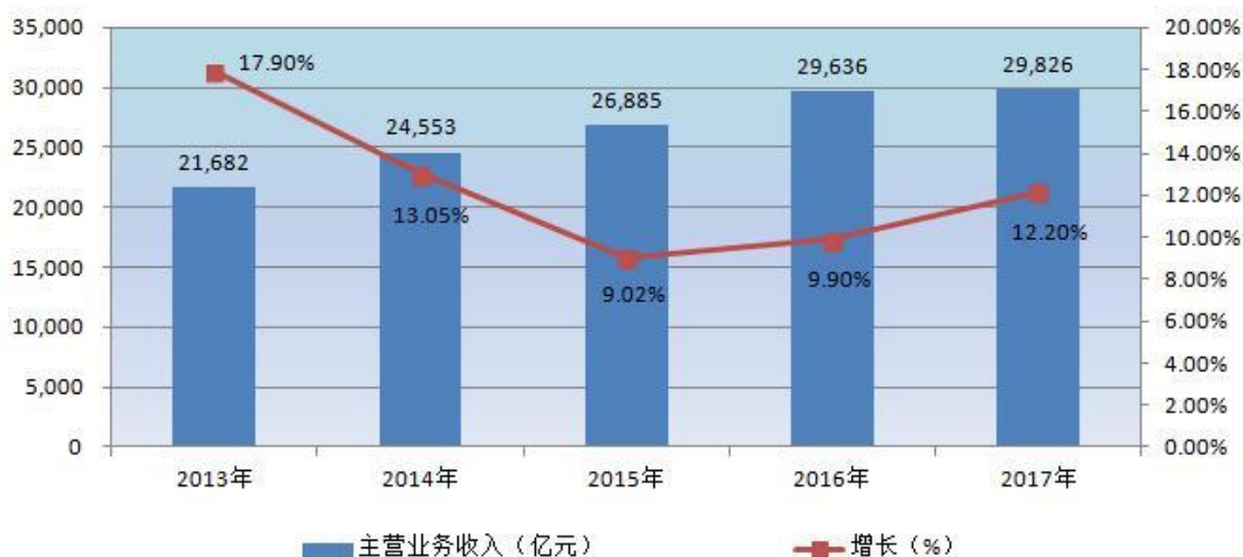
最近五年医药工业规模以上企业利润总额及增长率情况