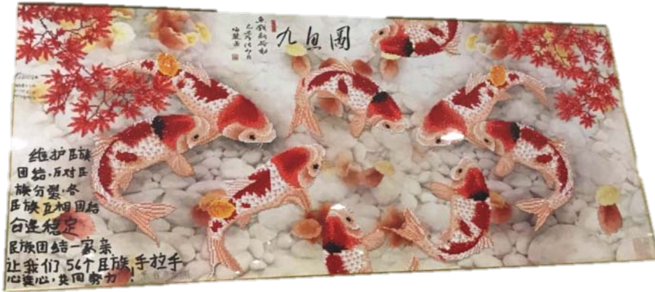
( 枫叶九鱼图 )

岗位。一年来，近 200 位少数民族员工进厂后，公司全体职工像对待自己的兄弟姐妹一样对待他们，致力于把章丘电机建设成为少数民族员工的“第二故乡”。新疆维吾尔族员工美合日古丽·巴图尔送上了历时 3 月完成的枫叶九鱼图表达对公司感恩之情。