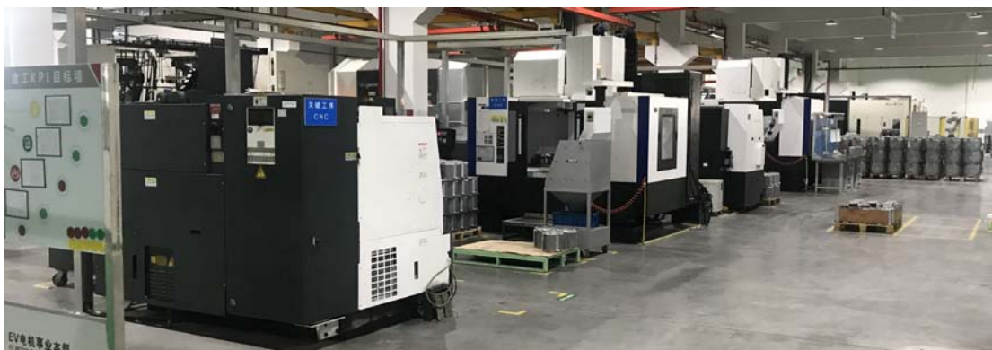
EV 事业部工厂（新能源汽车电机制造工厂）