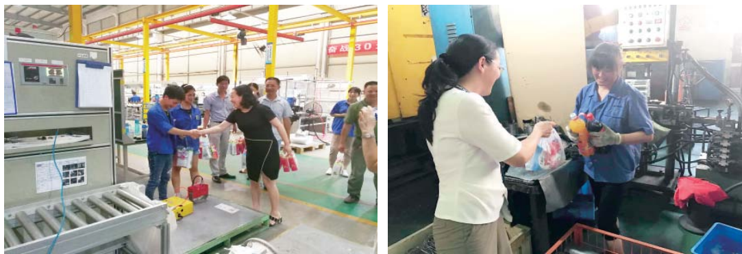
公司工会组织车间一线高温慰问活