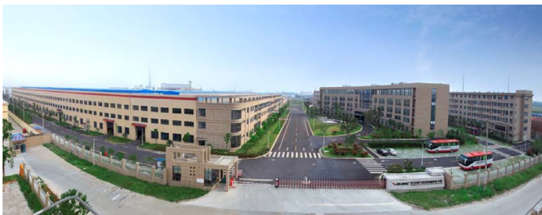
绍兴灯塔电源基地