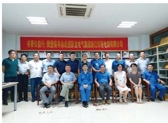
樊登读书会走进卧龙电源本部