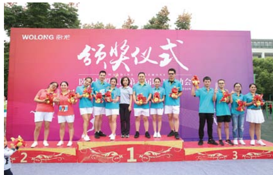
第六届职工运动会