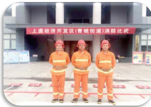
消防安全培训和消防比武