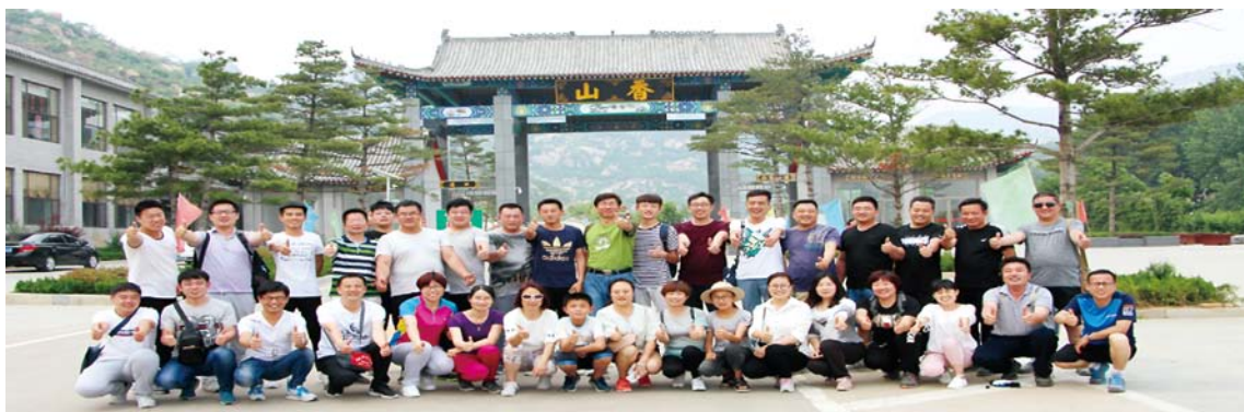
章丘电机组织“一路同行 感恩有你”主题拓展活动