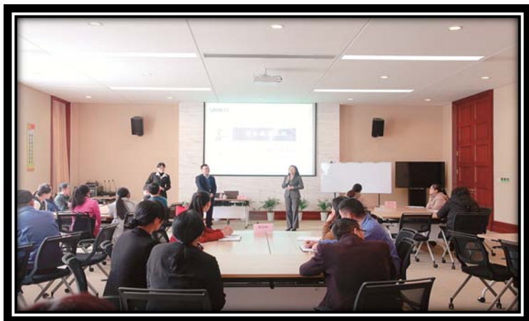
企业公开课——打 造“内外兼修”的职 场人