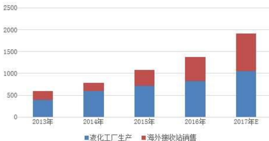
我国LNG供给结构变化（单位：万吨）