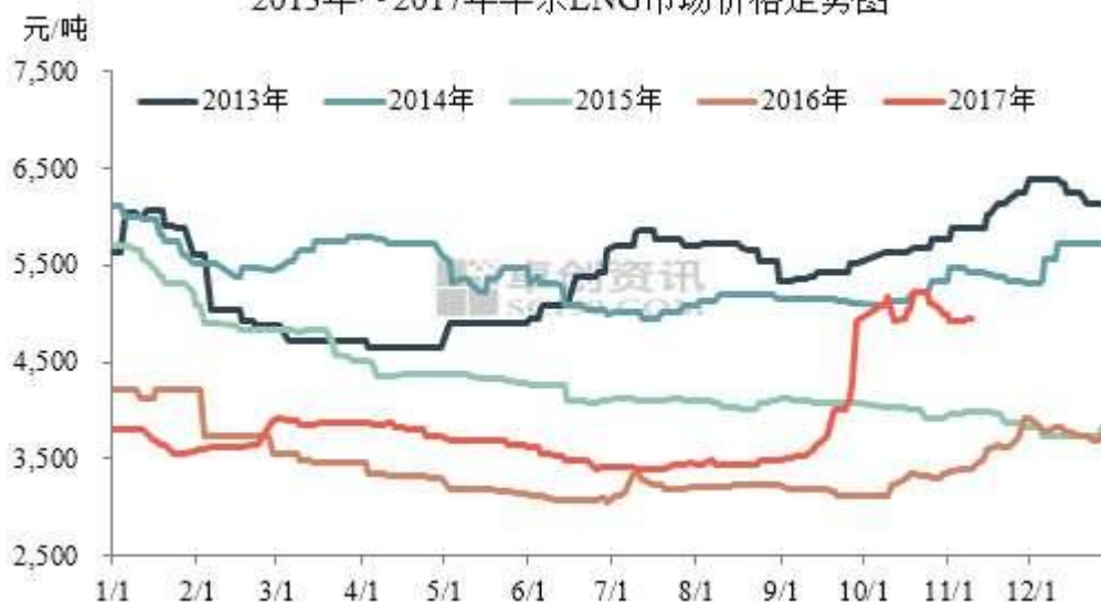
2013年~2017年华东LNG市场价格走势图