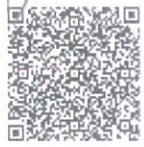
在线扫码获取详细信息