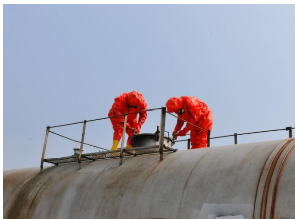
图 3.8 技能竞赛现场

公司全年进行“三新人员”岗前安全教育和理论培训 158 人次；开展全员劳动安全，汛期、防护知识、行车适应性等培训，培训 2000 余人次；组织开展危货、消防、防洪、防断等应急演练。组织车站值班员、轨道车司机、探伤工、特种设备作业人员共 31 人送外培训；举办货场经营部、货运车间、收入结算部、运转车间、工务车间、电务车间各工种技能竞赛，评选出各工种优秀职工 69 名，并给予奖励，如图 3.8 和图 3.9 所示。