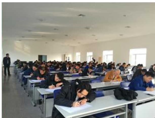
图 3.7 业务学习考试现场