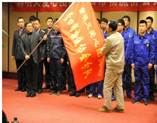
图 3.10 职工献爱心活动

为确保员工身体健康，本着“预防为主”的方针，公司每年都组织对公司全体员工进行一次健康体检，体检期间指派专人每天到体检中心，为员工服务，遇到问题当场解决，体检率达到 100%，对体检发现问题的员工，公司及时通知本人，真正把“预防为主”的方针落到了实处。