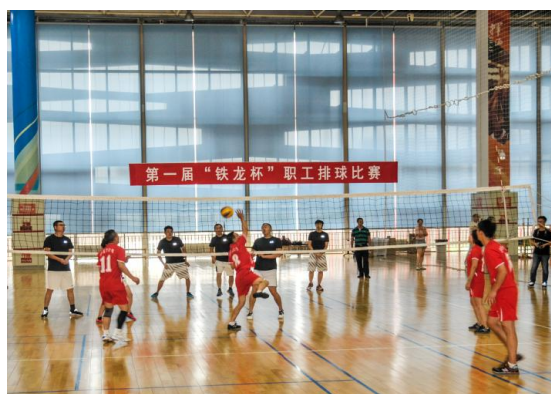
图 3.11 排球比赛现场