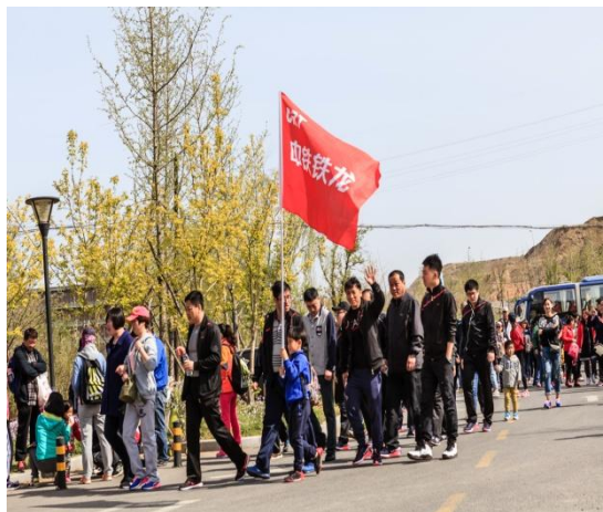
图 3.3 职工健步行