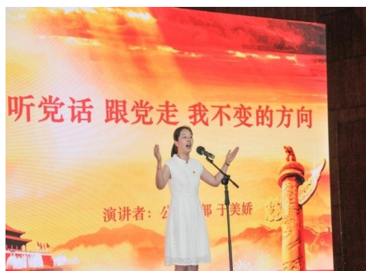
图 3.12 “党在我心中”演讲比赛