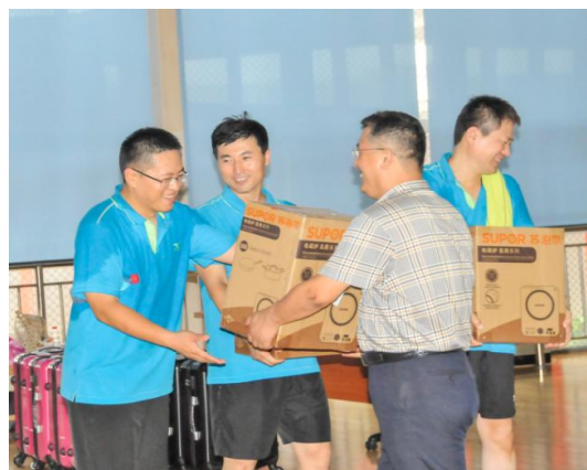
图 3.11 活动颁奖