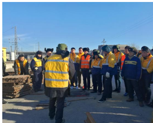
图 3.9 技能竞赛现场