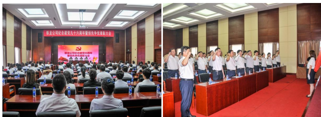
图 3.10 庆祝建党 96 周年

公司党员干部认真学习贯彻党的十八届六中全会和十九大精神，推进“两学一做”学习教育常态化制度化，使党员干部普遍受到了一次严格的党性锻炼。围绕3个专题，组织开展集中学习和专题研讨交流。公司领导干部深入联系点讲党课56场，参加双重组织生活83次，政治意识、大局意识、核心意识、看齐意识普遍增强。深入开展“三重”党日及庆祝建党96周年系列活动，唤醒党员入党初心。组织党员教育活动，如图3.10、图3.11和图3.12所示。每名党员结合实际，按照“一岗一标”，确定合格党员标准，全体党员的党性意识、党员意识和政治素质得到不断加强。