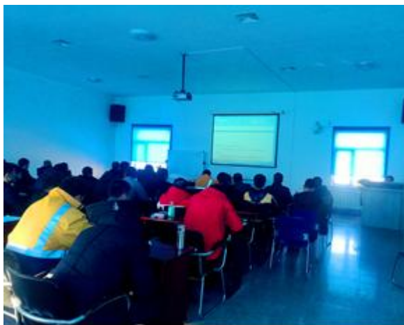
图 3.6 业务学习考试现场

沙鲮铁路分公司 2017 年全方位、多形式深入开展培训工作。积极完成各类资格性、适应性和临时性培训；接轨铁路总公司、铁路局，送外培训；强化月度业务学习，如图 3.6 和图 3.7 所示；开展多种非正常情况应急演练；组织各工种职工技能竞赛。