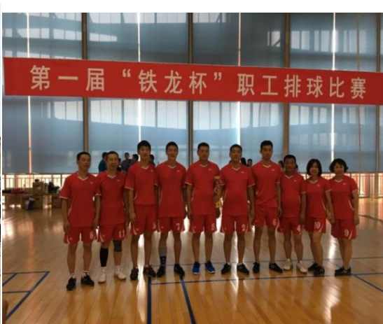
图 3.4 排球赛