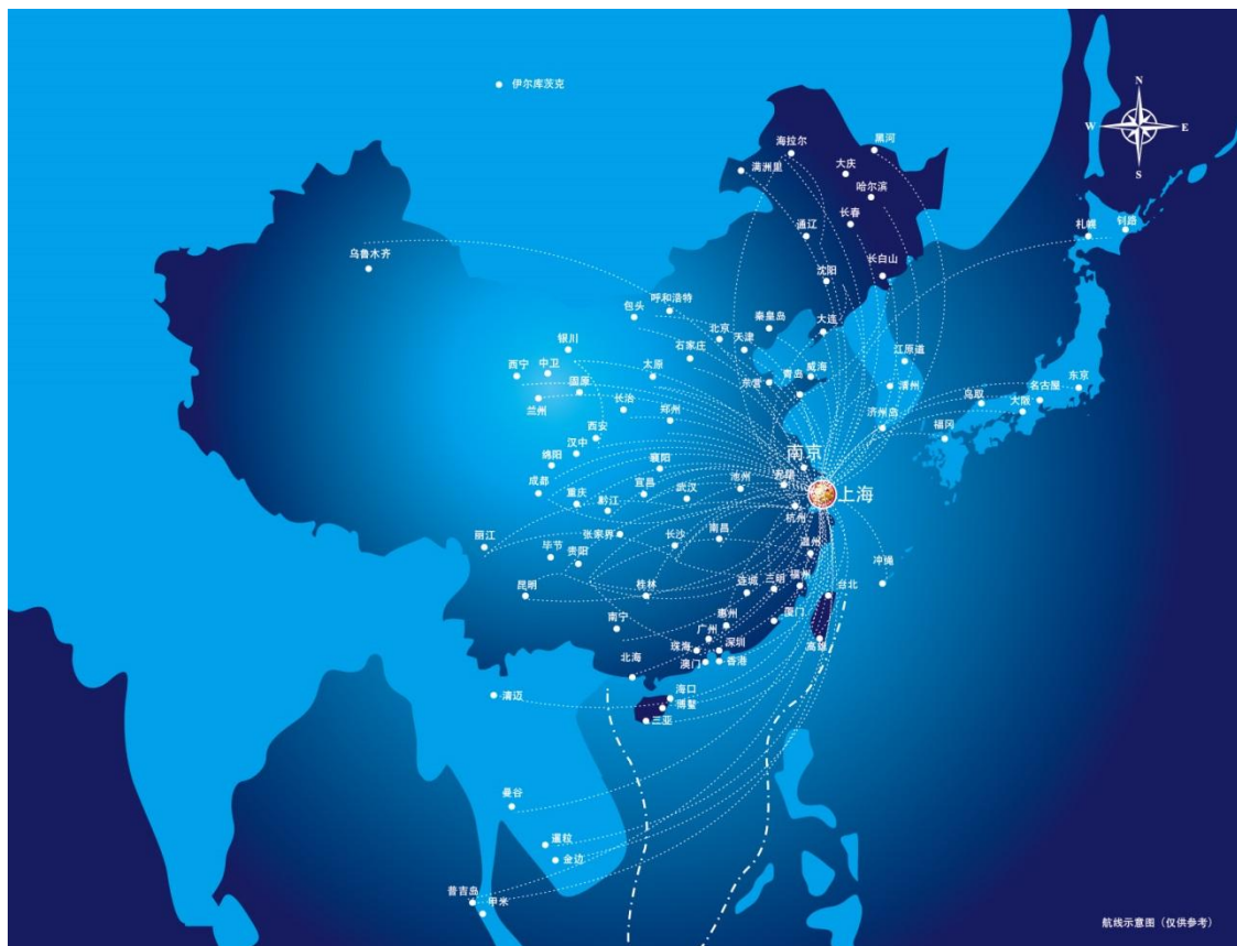
九元航空航线网络图