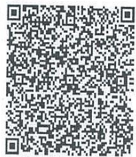
王龙旷年检二维码

本证书经检验合格, 继续有效一年。 This certificate is valid for another year after this renewal.